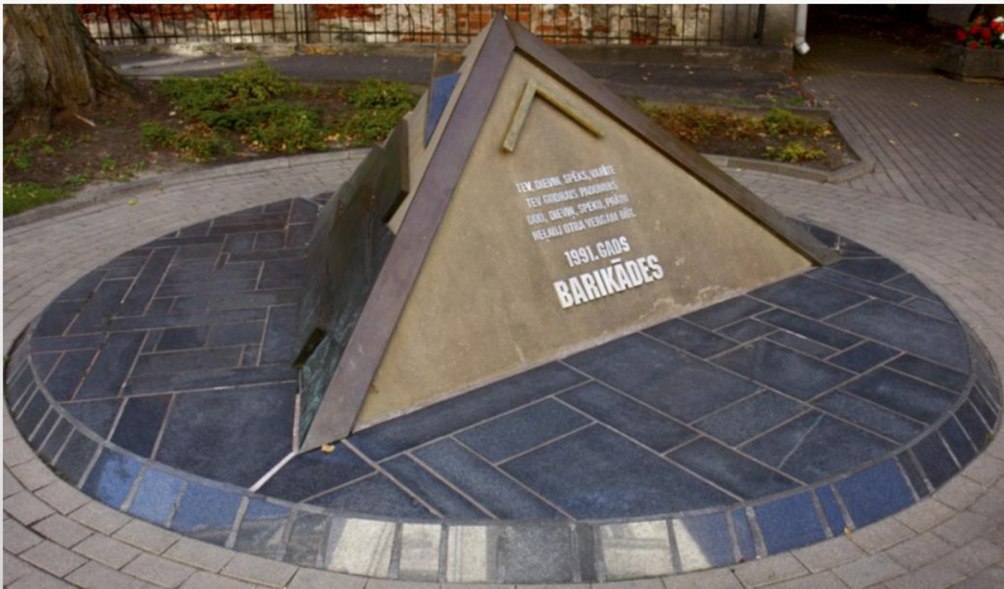
1991. gada Rīgas Barikāžu piemiņas zīme Vecrīgā pie Saeimas nama. 3 metrus plata un 1,75 metrus augsta piramīda. Autors: dizainers Sandro Čaidze. Atklāta 2007. gada 20. janvārī.